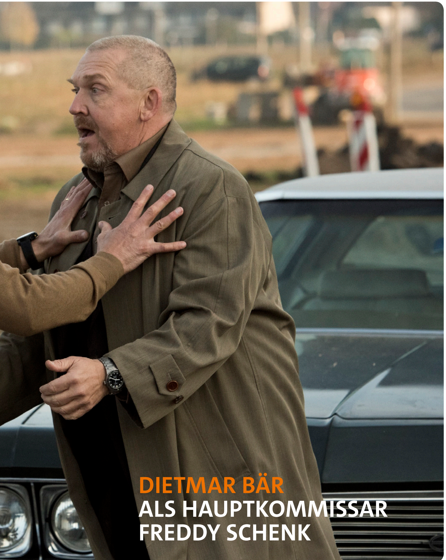
DIETMAR BÄR ALS HAUPTKOMMISSAR FREDDY SCHENK