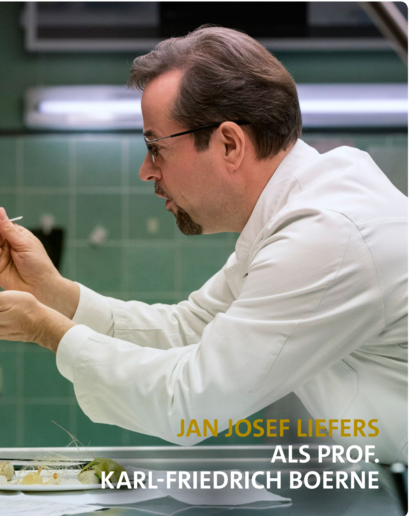
JAN JOSEF LIEFERS ALS PROF. KARL-FRIEDRICH BOERNE