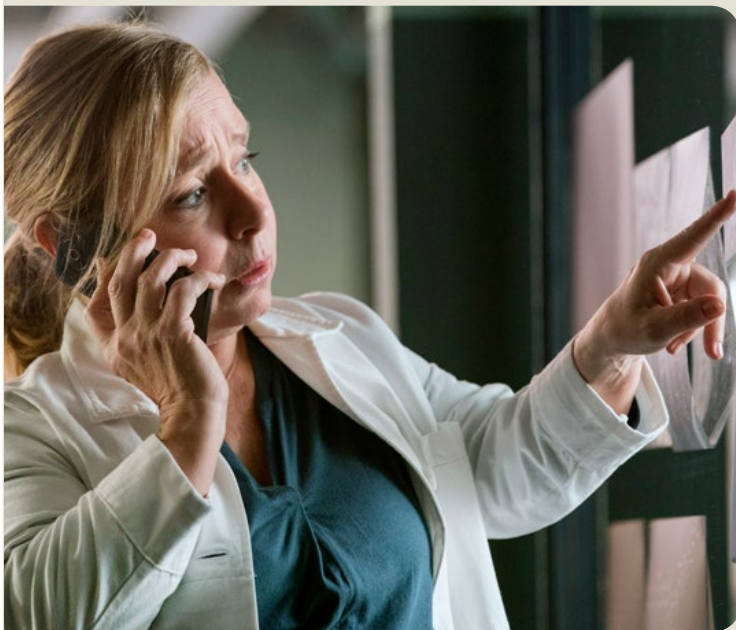
CHRISTINE URSPRUCH als Silke »Alberich« Haller

Auf Nadeshda Krusenstern kommt es an bei diesem Fall: Ihr Chef, Hauptkommissar Thiel, hat eigentlich Urlaub. Sie leitet jetzt die Ermittlungen. Kein leichtes Unterfangen. Schließlich muss sie sich gleich zwei Staatsanwältinnen gegenüber rechtfertigen. Und im Zoo wurden offensichtlich Tiere gestohlen, u. a. ein schwarzweißer Vari, eine Affenart. Führt diese Spur zur Aufklärung des Mordfalls?